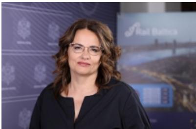
Ilonda Stepanova, Valsts sekretāre

Ministrija saviem darbiniekiem piedāvā profesionālās kvalifikācijas celšanas un izaugsmes iespējas, iespējas strādāt daļēji attālināti un elastīgu darba laiku, papildu brīvdienas ikgadējam atvaļinājumam, kā arī veselības apdrošināšanu pēc sešiem nostrādātiem mēnešiem.