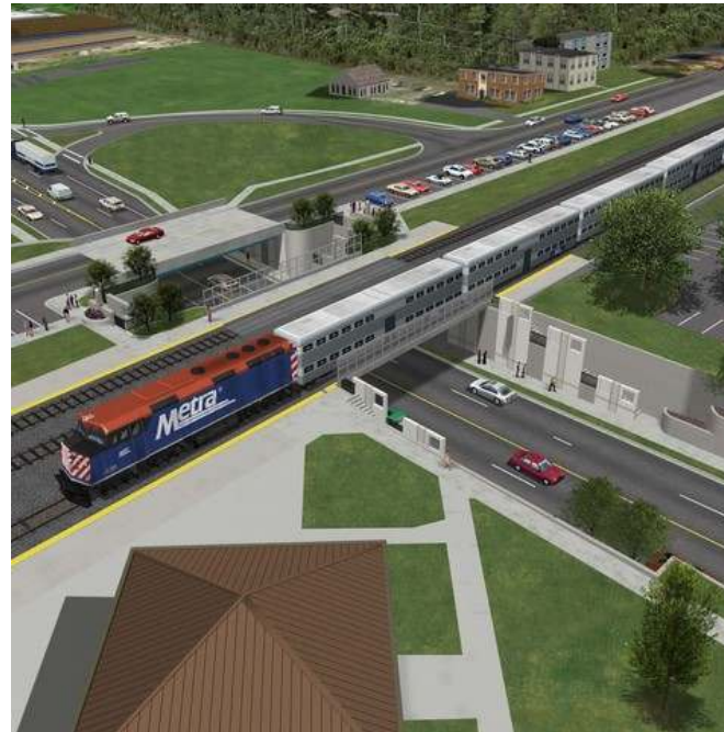
Šķērsojumi ar autoceļiem